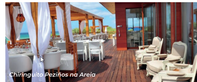
Chiringuito Pezinhos na Areia

En Praia Verde, por debajo del restaurante O Infante Panorámico. Ideal para cenar. Me encanta. Es uno de mis preferidos. Además de los pescados se comen unos spaghetti con almejas y unas gambas con arroz al curry que quitan el hipo! El sitio es ideal... Noche romántica, aquí sin duda... Precio algo elevado.