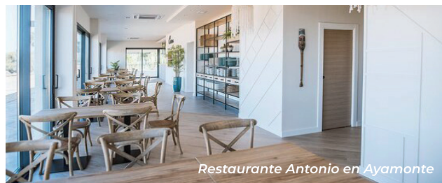
Restaurante Antonio en Ayamonte

Varios restaurantes en Punta de Moral típico por sus arroces caldosos. Tienen varios locales uno de ellos en la misma Marina Isla Canela, Antonio V y otro en el muelle frente a la ría mirando a Isla Cristina, Antonio IV. Ojo no acepta reservas y por tanto es mejor que vayas temprano. Precio medio.